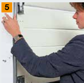
Защита от защемления пальцев в боковых направляющих