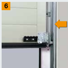
Трос, расположенный в направляющей

Вы хотите больше безопасности? Тогда обратитесь к официальному представителю Hörmann в Вашем регионе!