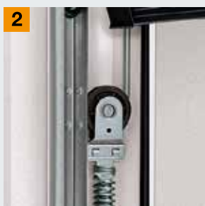
Система пружин растяжения