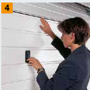
Защита от защемления пальцев