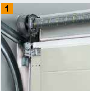
Система торсионных пружин